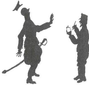
Een van de silhouettekeningen die De Jong zelf maakte voor de Notities van een landstormman